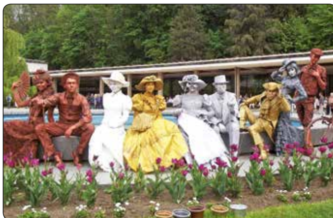
... jaké akce pořádal Český svaz žen.