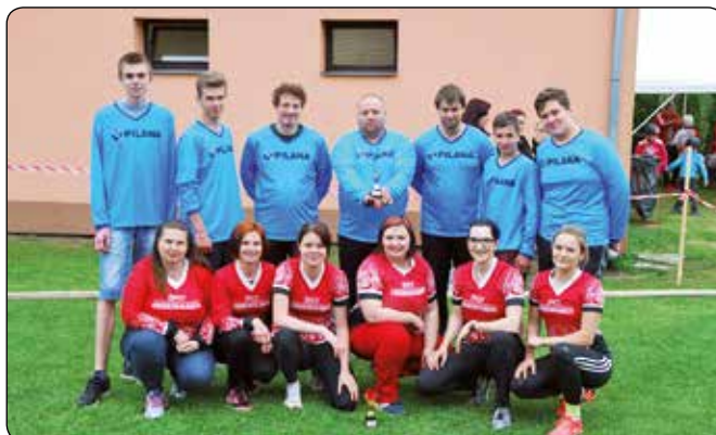
... kde všude soutěžili hasiči.