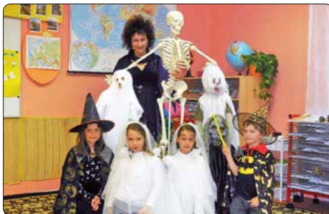
... o Dni čarodějnic ve škole.