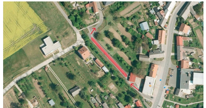
Označení náhradního parkoviště

Obec i stavební firma žádají obyvatele ulice o trpělivost při omezeních, která se jich budou během oprav týkat. Během rekonstrukce bude zvýšená prašnost a hlučnost.